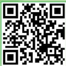
学院官方咨询二维码