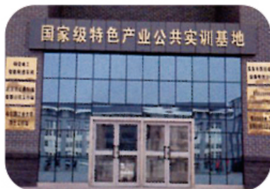
国家级特色产业公共实训基地