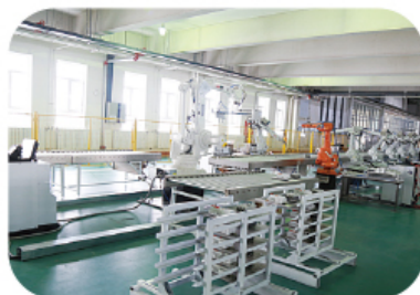
工业机器人智能生产线