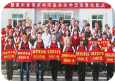
学院各类助学资助受助仪式