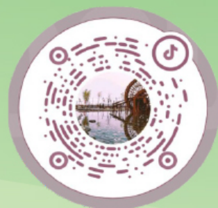
学院抖音咨询二维码