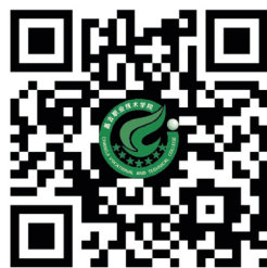
学院官方网站二维码