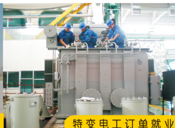
特变电工订单就业

机电工程分院（特变电工分院）现有专兼职教师共97人，其中：教授1人，副教授17人，高级技师5人，技师12人，硕士研究生25人，自治区教学能手与优秀教师6人，专业带头人与骨干教师18人，双师素质教师占86%，目前在校生近3000余人，81个教学班。现有设施先进的中、高级维修电工、工业自动化生产线、机床电气维修、电子产品装配等34个集教学、培训、考工鉴定、技能大赛为一体的理实一体化校内实训室。与特变电工等现代装备制造业龙头企业建立校外实习基地并签订订单培养协议，毕业生在全疆大中型企业中为技术骨干，就业率始终保持在98%以上，职业资格证书获取率100%。