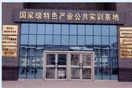
国家级特色产业公共实训基地