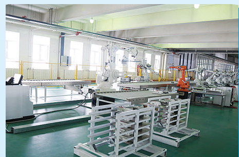
工业机器人智能生产线