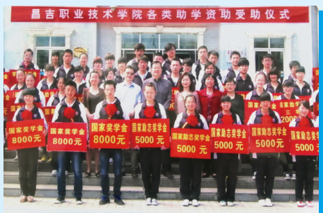
学院各类助学资助受助仪式