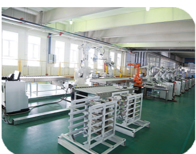
工业机器人智能生产线