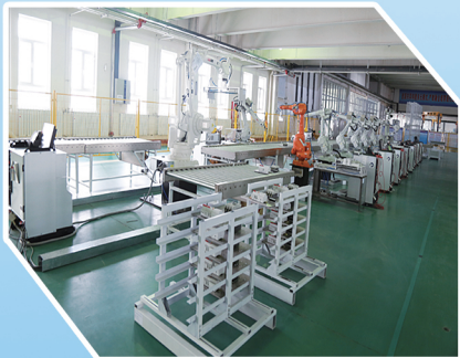
小三箱底板智能装配线