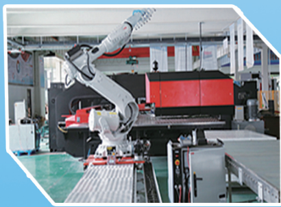
电控柜壳体智能生产线