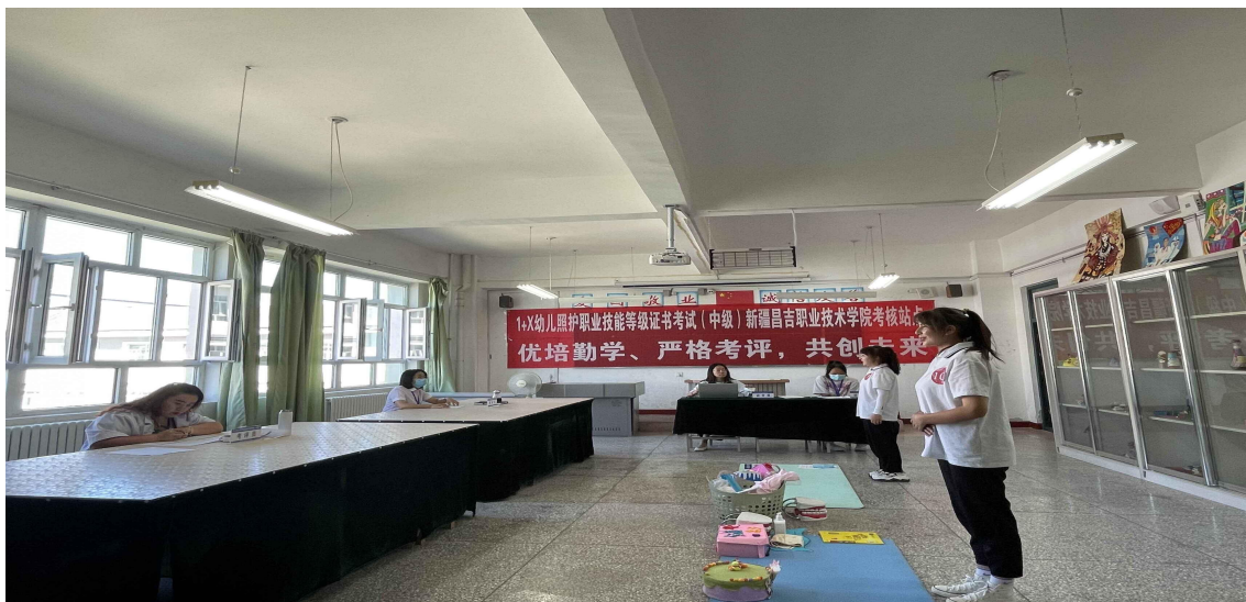
2022 承办幼儿照护培训及考试提升学生能力