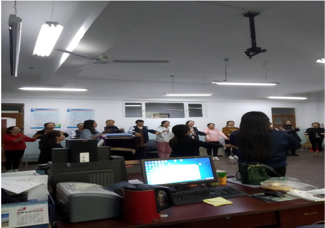
分院教师培养师带徒