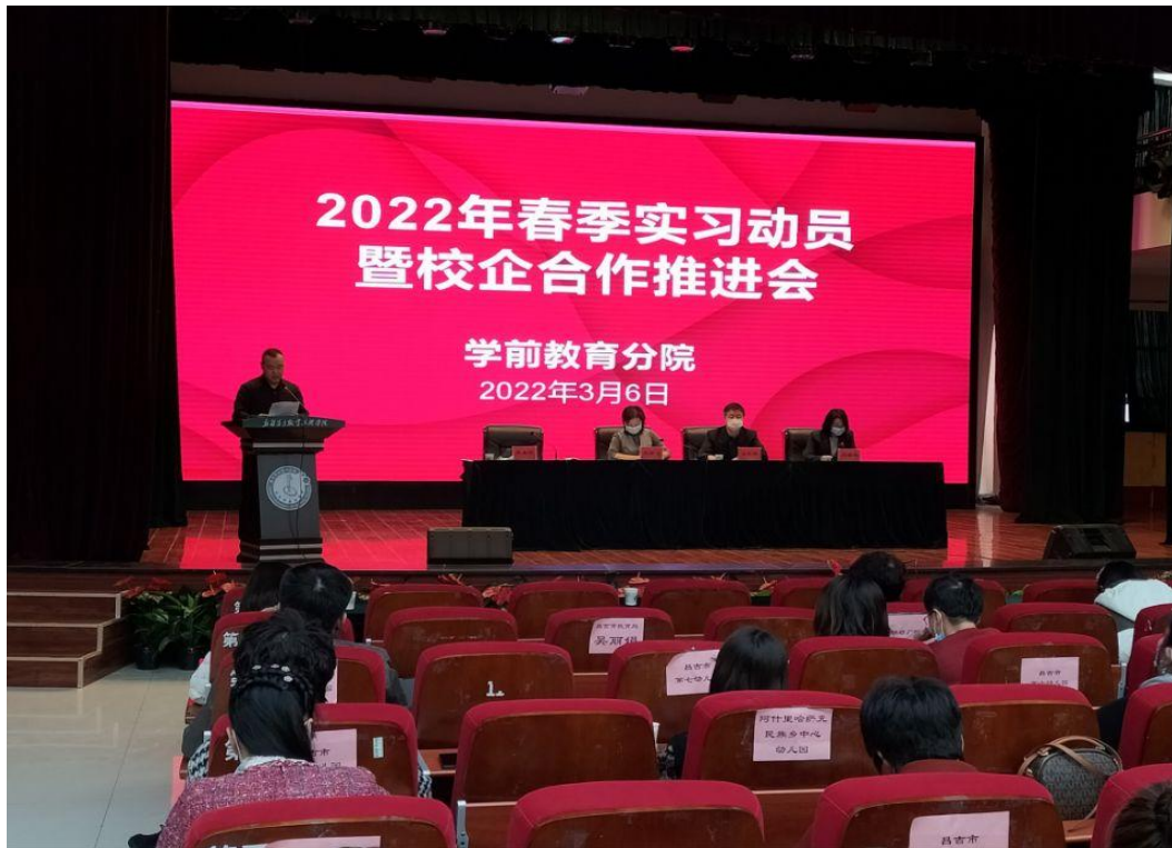
2022年3月开展春季实习动员及校企合作推进会