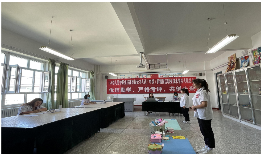
2022年6月开展1+X 幼儿照护职业技能等级证书考核