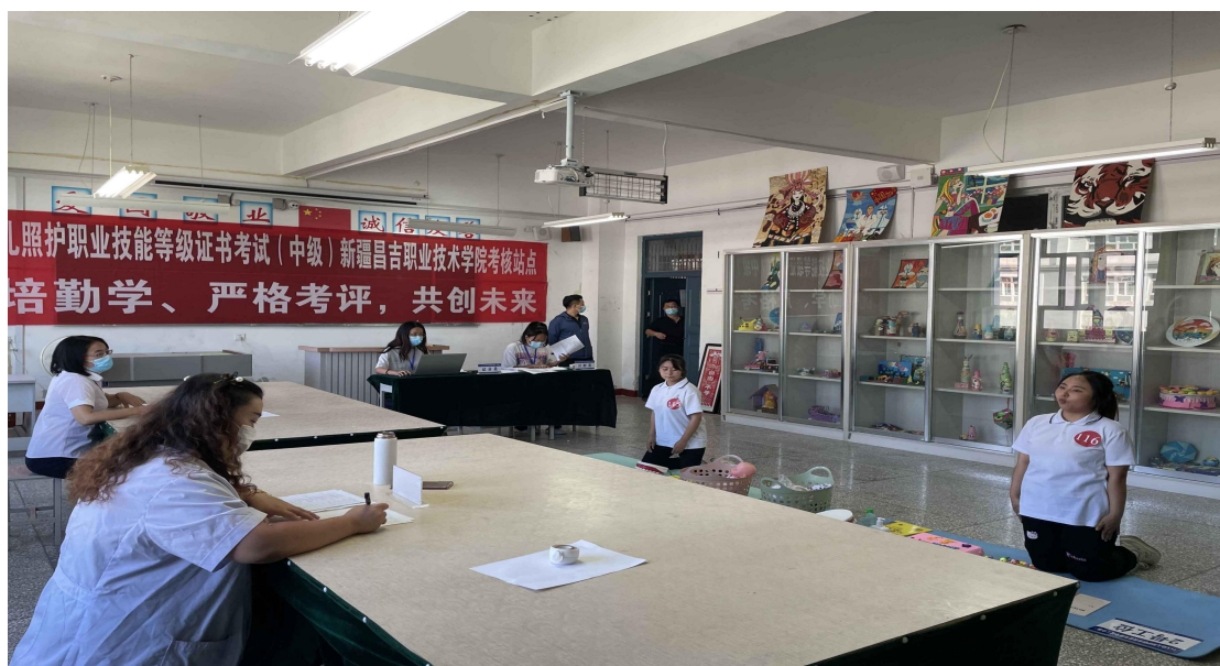
2022 承办幼儿照护培训及考试提升学生能力