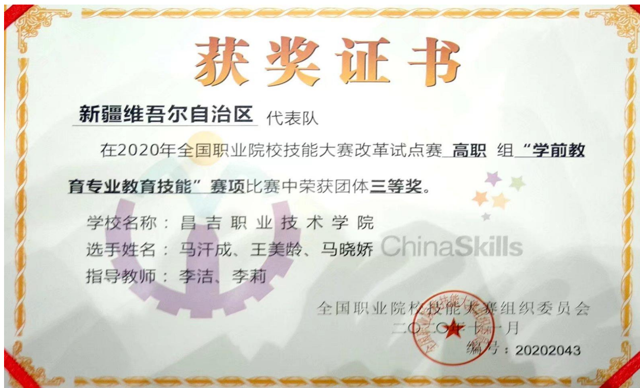
2020 年参加全国职业院校技能大赛获团体三等奖