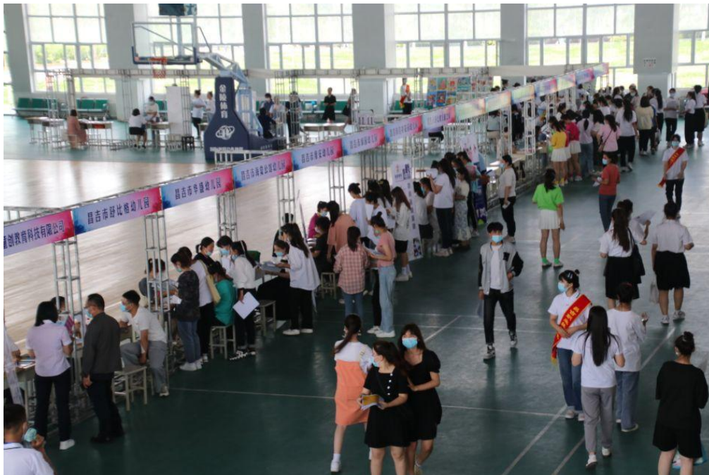
2022年5月组织开展校园招聘会