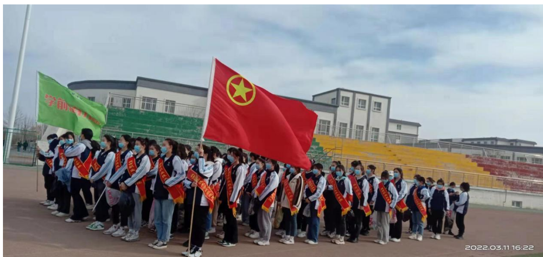
学前教育分院青年志愿者服务队