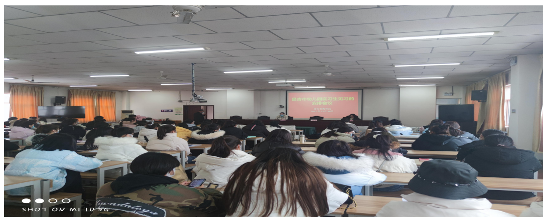
昌吉州教育局与分院联合培训顶岗实习学生