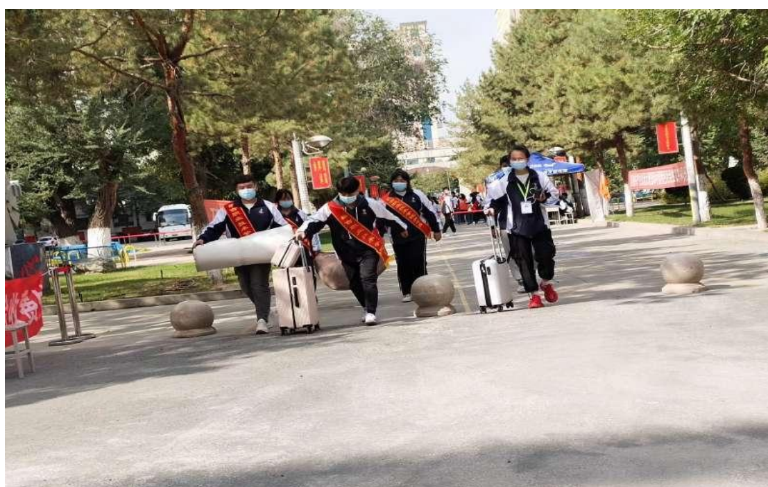
2021 年秋季开学迎接新生报到