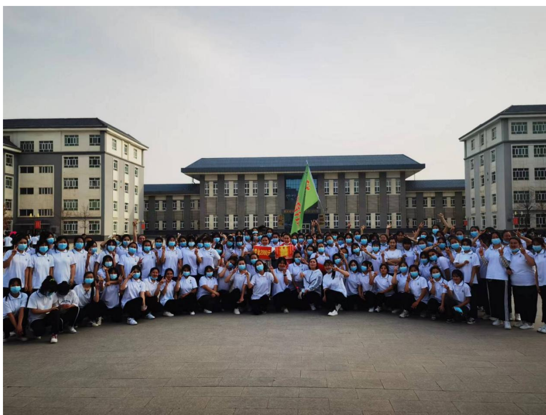
2022年4月学前教育分院荣获学院第一届“青春歌舞”广场舞比赛第一名