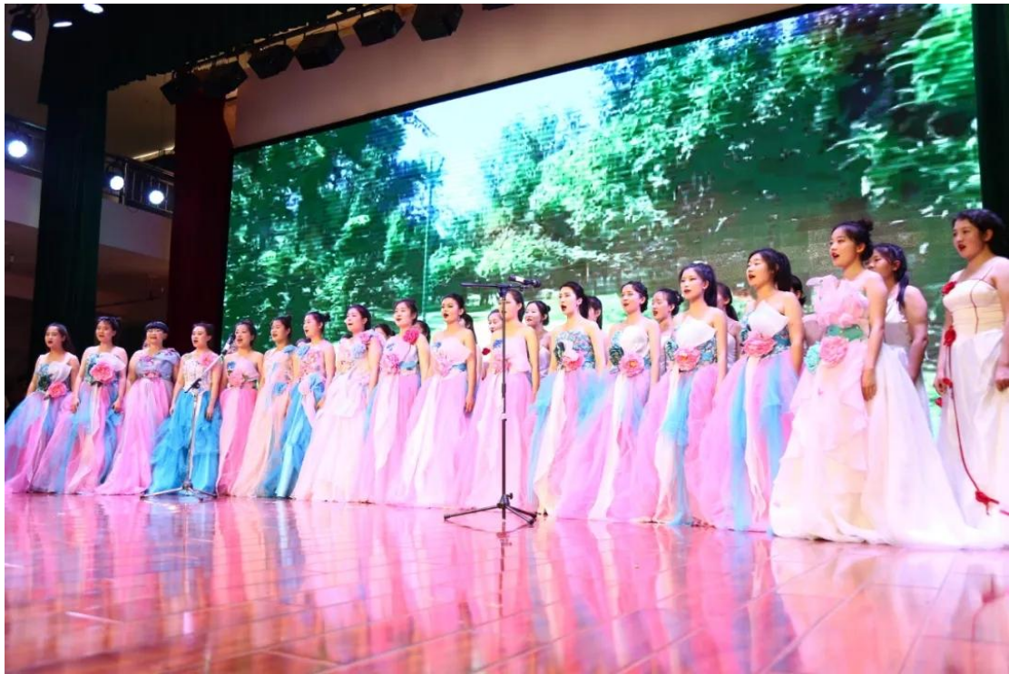
2022年5月开展2022届毕业生汇报演出

2018年以来，分院组队参加职业技能大赛屡获殊荣，2020年代表新疆参加全国职业技能大赛率先实现零的突破。还先后获2018年自治区职业院校技能大赛中职组一等奖，2019年自治区职业技能大赛高职组一等奖，2020年全国职业技能大赛高职组三等奖，2021年自治区职业技能大赛高职组二等奖，2022年全国职业技能大赛高职组三等奖，分院曾获2019年昌吉州巾帼文明示范岗荣誉称号。