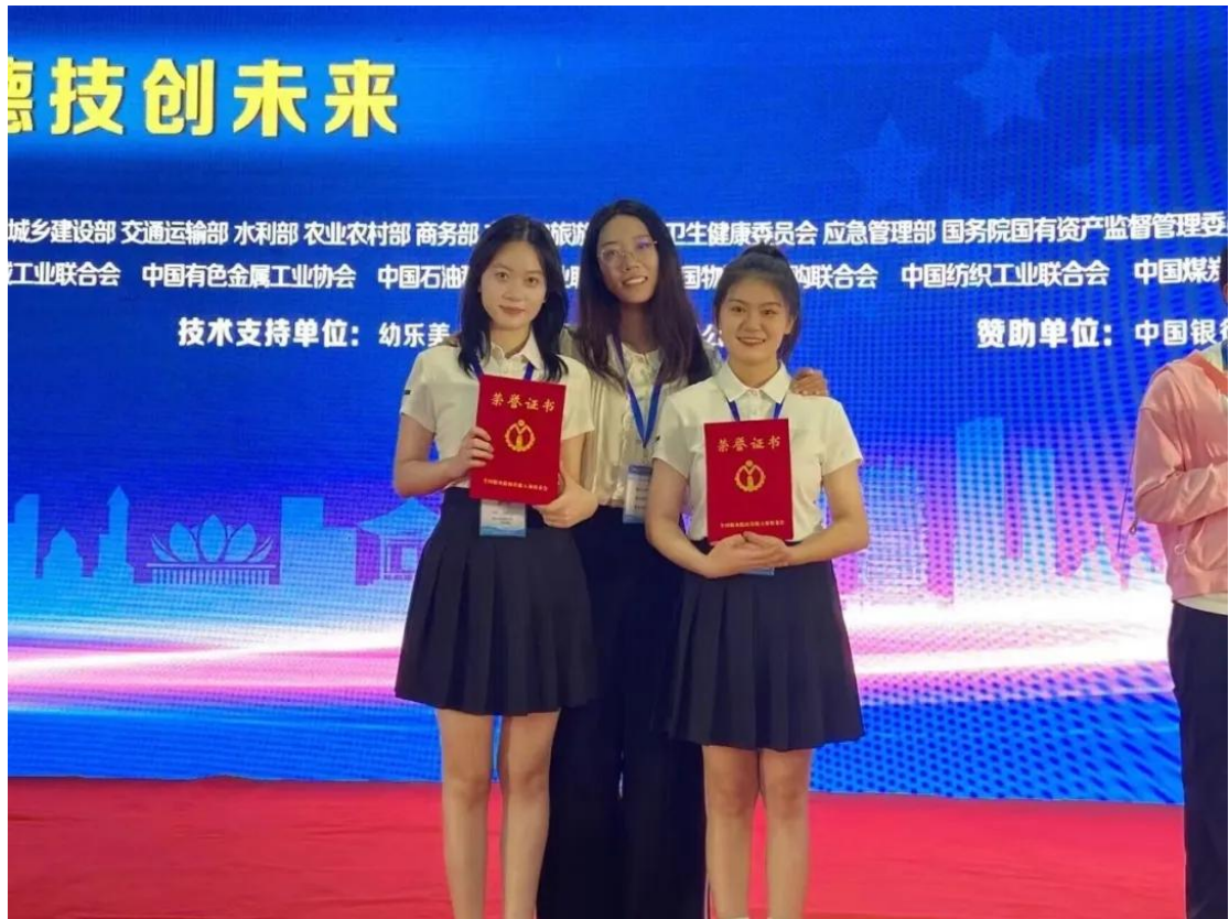
2022年8月参加全国职业院校技能大赛获团体三等奖