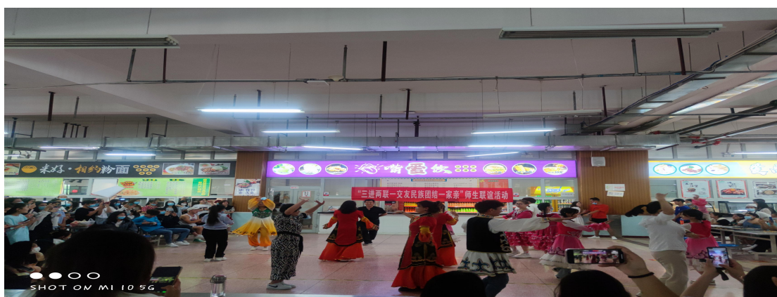
2022年3月开展三进两联民族一家亲活动